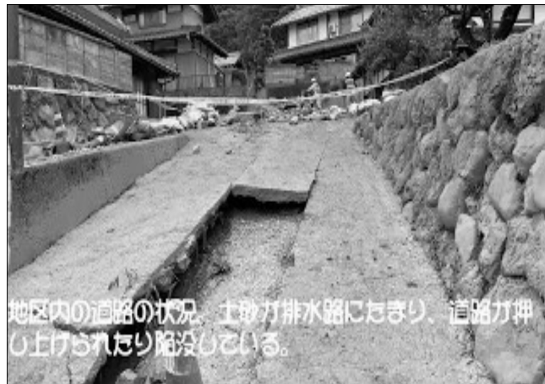
地区内の道路の状況。土砂が排水路にたまり、道路が押し上げられたり陥没している。