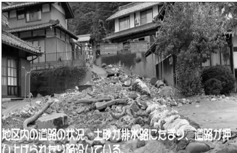
地区内の道路の状況。土砂が排水路にたまり、道路が押し上げられたり陥没している。